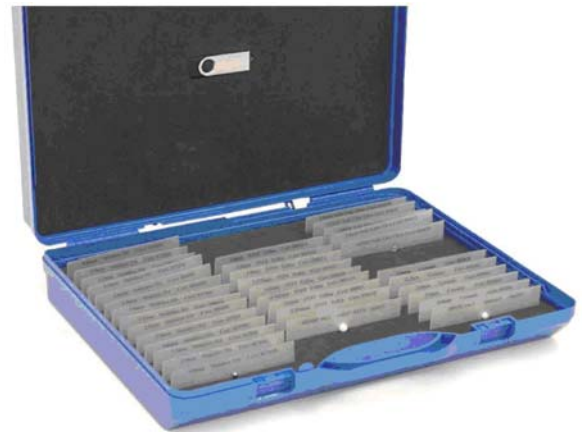
技師套件 XRAY SHARK®

舉例：值班的品質經理必須在每次轉班開始後一個小時使用測試物件測試檢測機，測試結果記錄在日誌，寫上日期、時間和簽名。如：測試物件確認，2016年8月24日、08.30、簽字、史密斯。