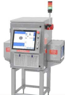
XRAY SHARK® X-射線