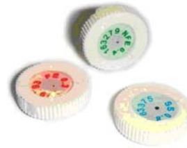
有認證的測試片 適用於 METAL SHARK® PH (藥片)