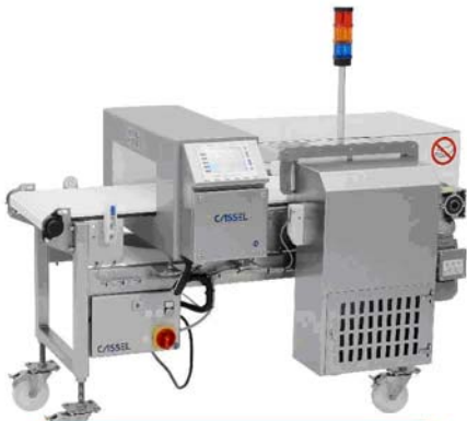
METAL SHARK® 輸送機