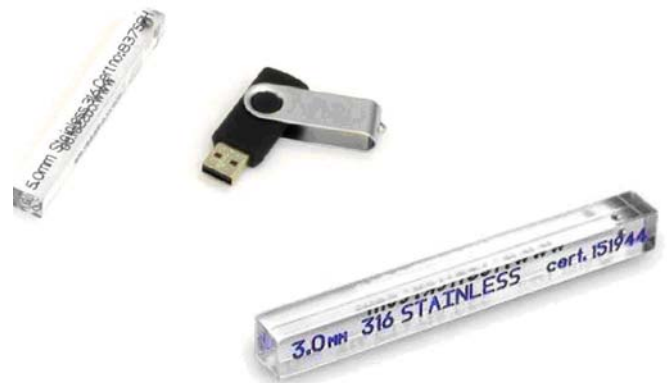
有認證的測試條 適用於 METAL SHARK® BD, TU