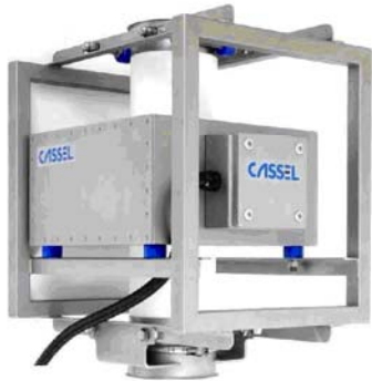
METAL SHARK® GF