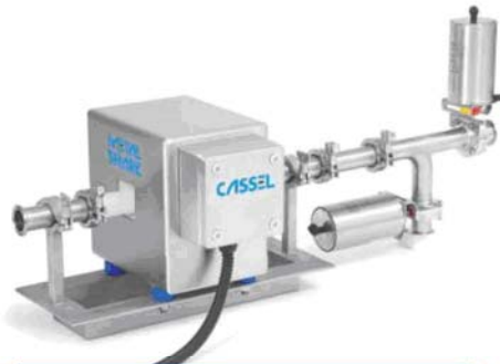
METAL SHARK® IN Liquid