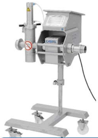
METAL SHARK® IN MEAT