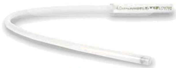
有認證的柔韌測試條