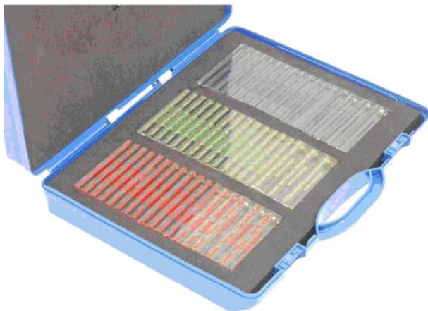
技師套件 METAL SHARK®