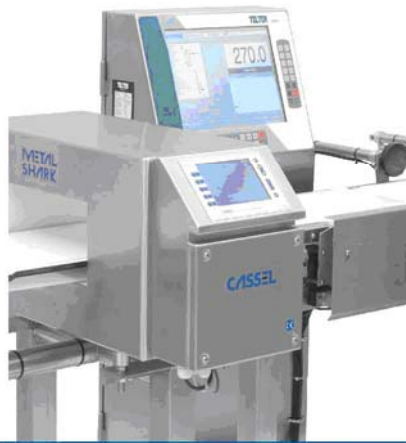
WEIGH SHARK® 自動檢重機